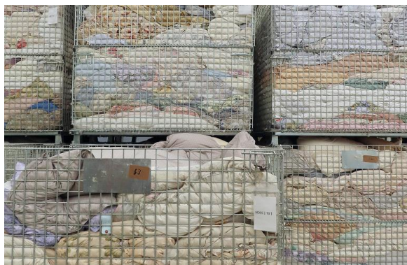
↑回収された羽毛ふとん