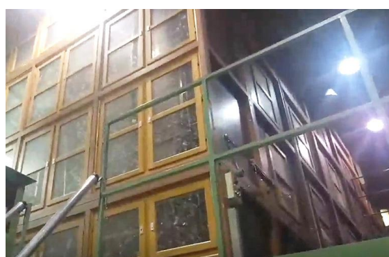
↑長く大きな木箱のような選別機

「くらしと生協」サイトでは、職員が実際に10年愛用した羽毛ふとんをリサイクルした様子をレポート。回収し、再生までの工程など生協のSDGsへの取り組みを積極的に公開することで、この取り組みを広く告知してまいります。