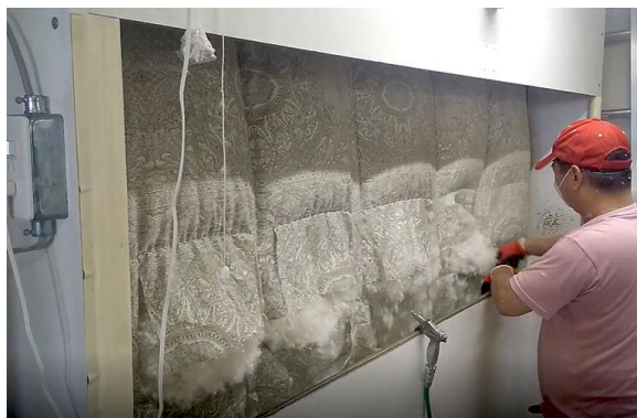
↑吸い取り機にセットし、側地をカット