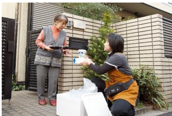
宅配や配食サービスを基盤に高齢者を見守り