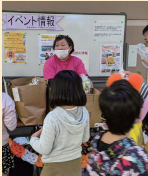
▲ami seedの活動の様子 「ハロウィンパーティーで 子どもたちにお菓子配り」