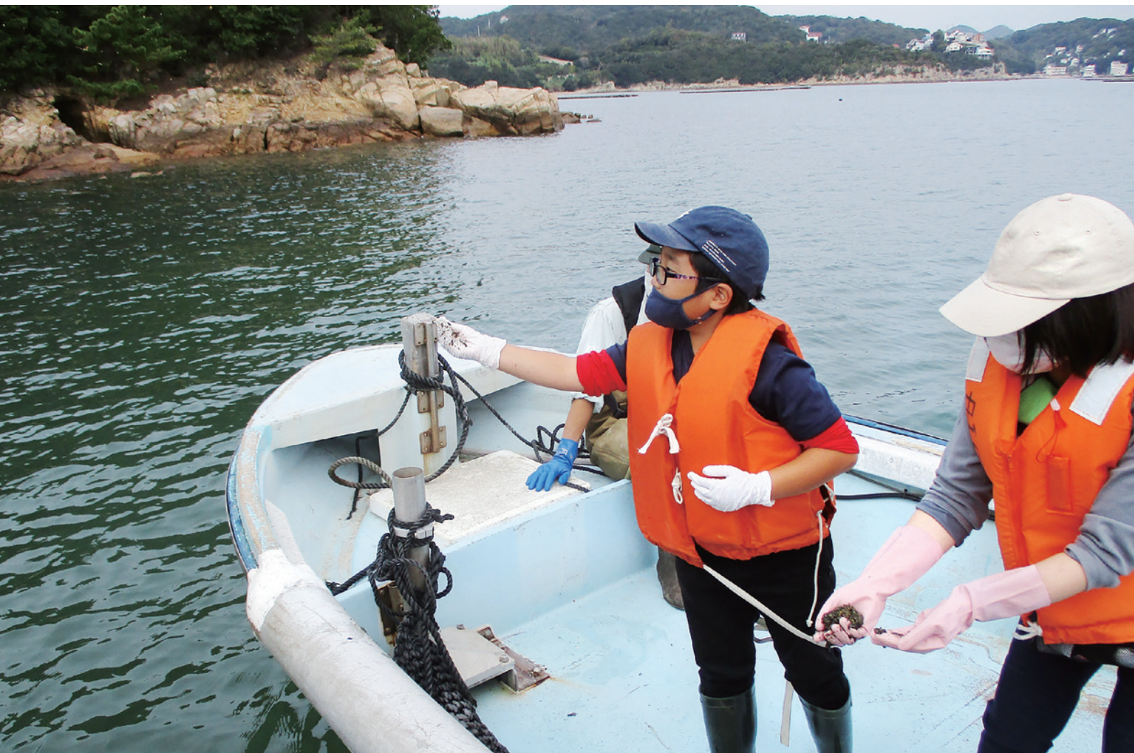
おかやまコープでは、「里山を守り里海を育てる活動」に取り組んでいます。写真はアマモの種まきの様子（関連記事はP4）