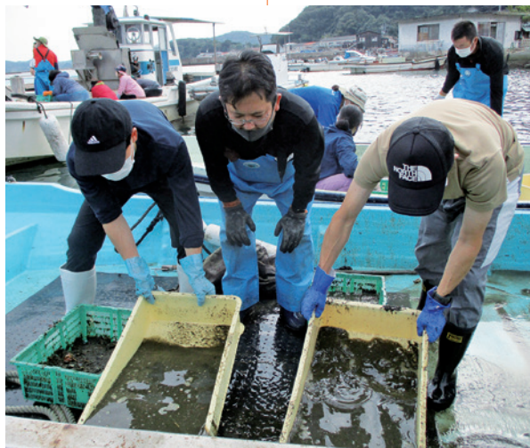
質のよいアマモの種をしっかりと選別します。

動していく予定です。里海を育てる活動では、「海のゆりかご」とも呼ばれ、多様な生き物が生命を育む藻場（アマモ場）の再生活動を応援しています。