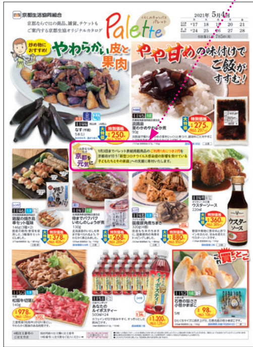
宅配カタログの表紙で、寄付の取り組みを案内しました。

京都生協では、京都府が創設した「新型コロナウイルス感染症対策応援寄附金」に寄付をするため、宅配用カタログ「くらしのキャンパスパレット」表紙の商品について、2021年5月4回〜9月3回の企画で取り組みを実施しました。 「一人ひとりの力で京都を元気に」のキャッチフレーズの もと、右記カタログ表紙の食