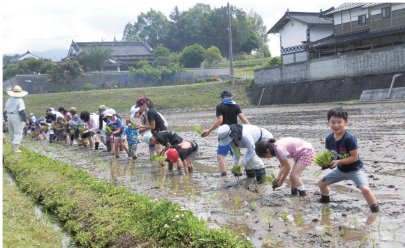
イキイキ田んぼ交流会では、田植えや稲刈り、食べるところまで体験します。

「イキイキ田んぼ交流会」は、稲を育て、収穫し、食べるところまで体験することで、生産の苦勞や喜び、食べ物の大切さを実感し、「コープのお米」（こしひかり）を身近に感じてもらうことを目的として、毎年実施されています。