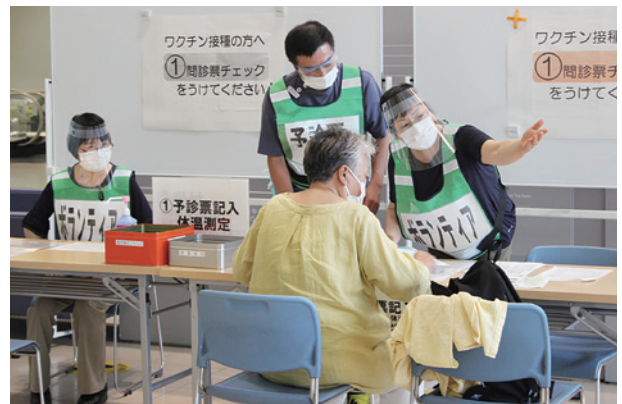
みなと医療生協（愛知県）組合員と職員が力を合わせたコロナワクチン接種

「予診票の書き方班会」は、地域での関心も高く、大きな反響を呼んでいます。ボランティアの地域組合員からは「お役に立てて嬉しい」、職員からは「組合員の力強さを感じた」などの声が寄せられました。