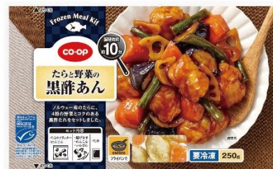
「CO・OP たらと野菜の黒酢あん」