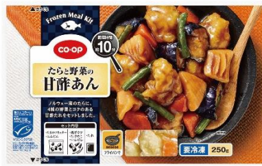
「CO・OP たらと野菜の甘酢あん」