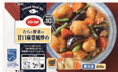
「CO・OP たらと野菜の甘口麻婆風炒め」