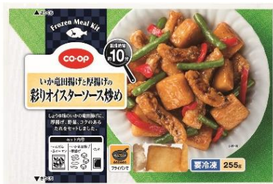
「CO・OP いか竜田揚げと厚揚げの 彩りオイスターソース炒め」