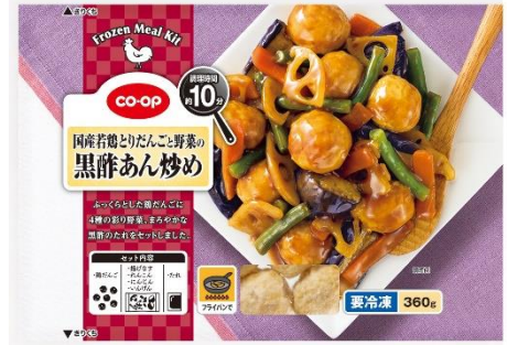
CO・OP 国産若鶏とりだんごと野菜の黒酢あん炒め

日本生協連の冷凍ミールキットは、昨年秋の発売以来、約10分で手間なく本格的なおかずを作れる手軽さで組合員から好評をいただいています。10月からの増税に伴い、軽減税率が適用される中食の需要が増える見込まれている中、今回発売する第2弾は、国産若鶏を使用したとり天およびとりだんごと野菜、たれをセットにした商品です。日本生協連では今後も、組合員とコミュニケーションをとりながら、中食需要に対応する商品の検討をすすめてまいります。