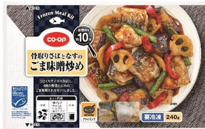
「CO・OP 骨取りさばとなすのごま味噌炒め」