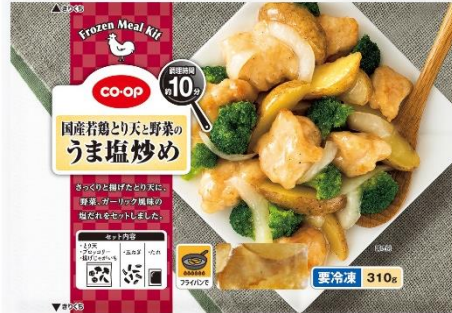
CO・OP 国産若鶏とり天と野菜のうま塩炒め