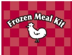
国産若鶏を使用した 新商品のロゴ

日本生活協同組合連合会（略称：日本生協連、代表理事会長：本田英一）は、冷凍庫にストックでき、凍ったまま炒めるだけで本格的なおかずが作れる「冷凍ミールキット」の第2弾となる「CO・OP 国産若鶏とり天と野菜のうま塩炒め」と「CO・OP 国産若鶏とりだんごと野菜の黒酢あん炒め」を2019年11月21日から発売します。