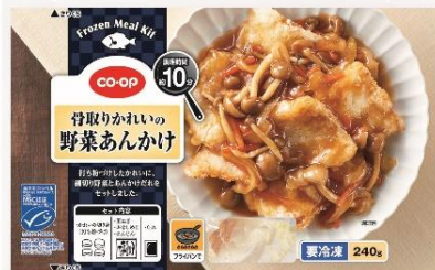
「CO・OP 骨取りかれの野菜あんかけ」