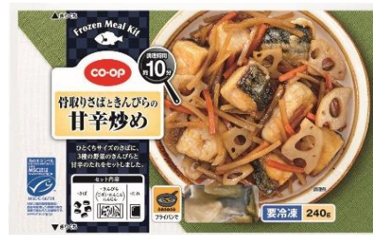
「CO・OP 骨取りさばときんぴらの甘辛炒め」