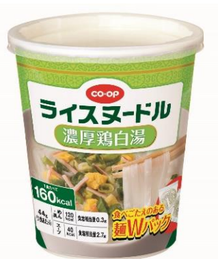
CO・OP ライスヌードル 濃厚鶏白湯

日本生活協同組合連合会（略称：日本生協連、代表理事会長：本田英一）は、ノンフライの米麺を使った「CO・OP ライスヌードル 濃厚鶏白湯」と「CO・OP ライスヌードル 麻辣担々」を2019年9月1日から発売します。