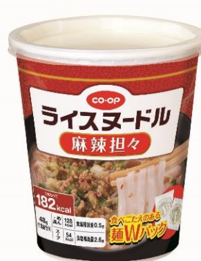
CO・OP ライスヌードル 麻辣担々

今回発売する本商品は、米粉とタピオカでんぷんを使用したヘルシーな米麺を使いカップ麺にした2品です。太めの平打麺は噛みごたえのあるモチモチとした食感が特長で、食べ応えがありながらカロリーは1食200kcal以下に抑えています。鶏白湯スープに濃厚なポークエキスを加えた「濃厚鶏白湯」と、みそと野菜の旨味にじびれる辛さの花椒をアクセントにした「麻辣担々」は、どちらもあっさりとした米麺によく合う濃厚なスープで、1食で満足感を得られる味わいに仕上げています。