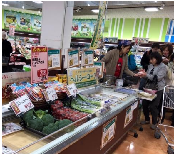
店舗での展開事例：福井県民生協では、ヘルシーコープレシピの試食を店舗で実施。