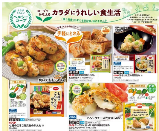
<宅配での展開事例：生活協同組合コープこうべ>