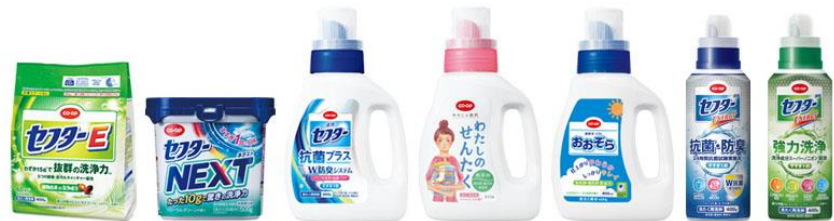
第8回「コープの洗剤環境寄付キャンペーン」対象商品

「ボルネオ緑の回廊」プロジェクトは、ボルネオ島の生き物たちの環境を保全するために、保護区や保存林の間にある土地を確保することによって、生物多様性を守る取り組みです。日本生協連では、衣料用洗剤の原料として使われるアブラヤシ農園がボルネオ島に数多くあることから、当寄付活動を開始し、これまでに約9.1ヘクタールの土地を「コープの森」として寄贈しています。