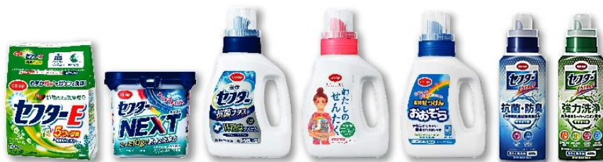
セフターEnergy(右から2品)は、6月のリニューアル後のデザインです。

「ボルネオ緑の回廊」プロジェクトは、ボルネオ島の生き物たちの環境を保全するために、保護区や保存林の間にある土地を確保することによって、生物多様性を守る取り組みです。日本生協連では、衣料用洗剤の原料として使われるアブラヤシ農園がボルネオ島に数多くあることから、当寄付活動を開始しました。