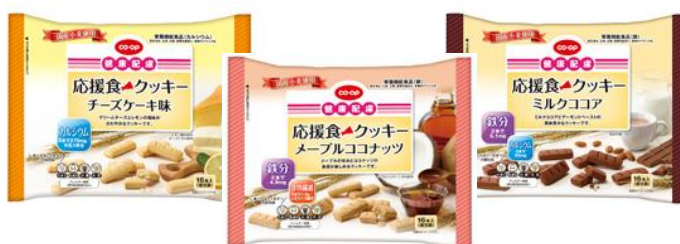
「CO・OP 応援食クッキー」シリーズ

日本生協連では、組合員からのご要望が多い健康に配慮した商品に対して、9月発売商品から共通の「健康配慮マーク」の表示を始めます。