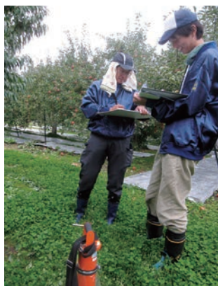
果樹園の放射性物質濃度測定の様子。

冬の間は、田んぼの測定が中心になわれていましたが、作付けの時期に入ったため、いったん田んぼの測定は終了し（県内の田んぼの35%が測定完了）、5月中旬からは果樹園を中心に進められています。