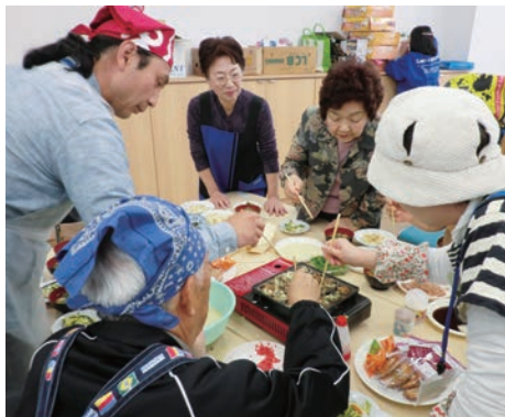
焼き方を教えてもらったみやぎ生協の組合員。「家でまたこ焼き作っています」。

5月17日、18日には、組合員19人と職員2人が「ボランティアバス」で宮城県の石巻市、女川町、南三陸町を訪問しました。17日は、みやぎ生協のメンバー（組合員）と「たこ焼き交流」を行いました。この企画は、大阪いずみ市民生協が、「組合員同士の交流会を開きたい」とみやぎ生協に依頼し