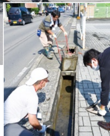
側溝のふたを裏返し除染。