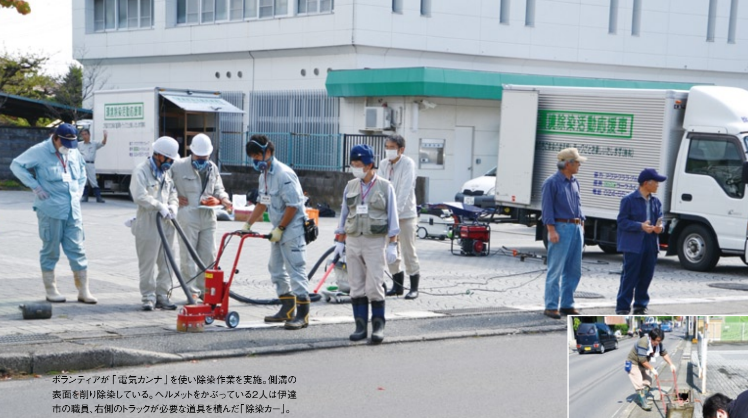
ボランティアが「電気カンナ」を使い除染作業を実施。側溝の表面を削り除染している。ヘルメットをかぶっている2人は伊達市の職員、右側のトラックが必要な道具を積んだ「除染カー」。