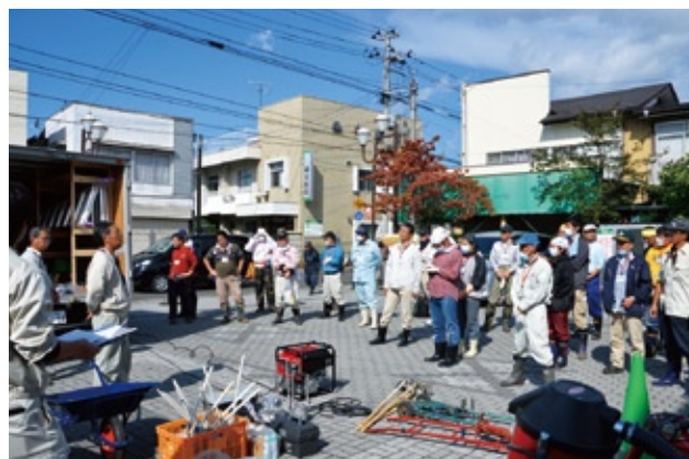
伊達市の職員がボランティアに作業手順を説明した。

「まず側溝のふた上部の放射線量を測定した上で取り外します。次に、ふたの周りの溝にたまっている泥やコケ、ごみなどをスコップでかき出して収集袋に入れてください。最後にふたを裏返しに取り付け、あらためて線量の測定をお願いします。なお、駐車場の入り口などは構造上裏返すことができませんので、『電気カンナ』(写真上)で表面を削り線量を測定してください。ゴム手袋はそのままでは破れてしまう恐れがあるので、上から軍手を付けて作業してください。なお、側溝のふたは大変重いので、けがには十分気を付けて作業をお願いします」