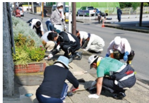
隙間など細かい部分の泥などもスコープを使い丁寧に取り除く。