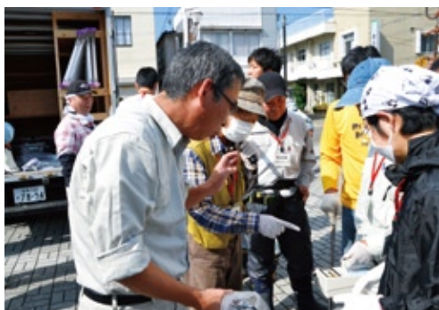
コープふくしまの野中専務(左)が線量計の使い方を説明。

※2 NPO 法人放射線安全フォーラム副理事長、前内閣府原子力委員会委員長代理。