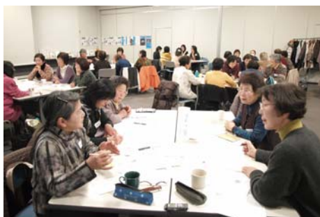
備蓄の大切さなどが話題に。