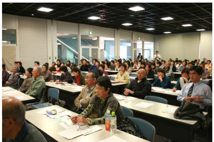
会場には多くの組合員やマスコミが集まった。