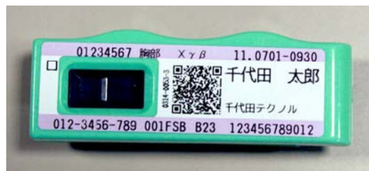
ガラスバッジの実物。これをケースに入れて、常に所持して計測する。

原発で働く人やレントゲンを使う医師など、職業として放射線に関わる人の線量限度は50ミリシーベルト/年※となっており、法令によってこの値を超えないように定められているといます。この数値は十分に安全性の余裕をみた値で、半世紀以上にわたって使われてきたものだそうです。そして、今回のガラスバッジによって測定された数値は、最も外部被ばくが多かった人でも、職業として放射線に関わる人の年間総量限度の10分の1程度