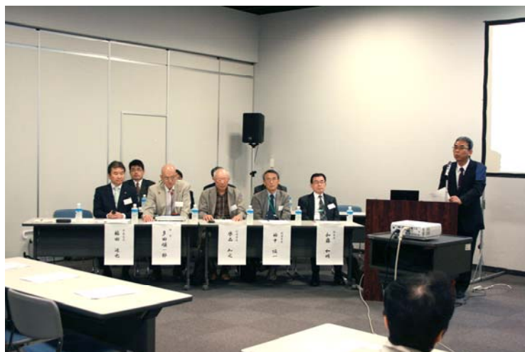
野中専務による挨拶。後ろに並ぶのが専門家の方々